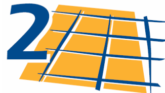
Padozatápolás 2. lépése: padló felületkezelése